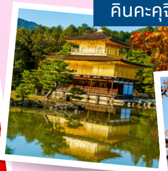
คินคะคุจิ