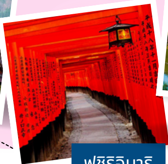
ฟูชิมิอินาริ